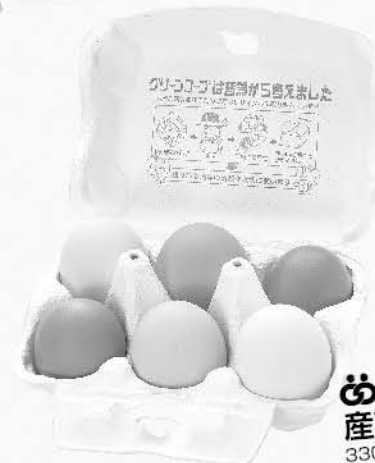
め元気いっぱい産直たまご6個 330g~410g 279円 (税込301.32円)