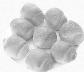
めリッチロール 8個(256g) 390円 (税込421.20円)

夫が長期連休を取れないので、日帰りで早朝から遠出することがよくあります。前の晩にゆで卵を作っておくと、お塩と一緒にそのまま持っていき車の中で食べられるし、時間のあるときはたまごサラダにしてリッチロールにはさみます。リッチロールは切り目を入れて中にマーガリンとジャムを塗ったり、その日の材料や気分ドライブのたびに色んな味を楽しんでいます。