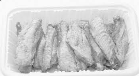
め若鶏ウィングチップ 250g 510円 (税込550.80円)

揚げるだけで簡単に骨付き唐揚げができます! 娘が大好きでよく食べるので徳用サイズがカタログに載るとよく頼んでいます☆