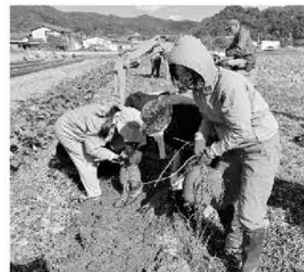
さつまいも収穫体験