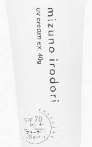
め水の彩 日焼け止め クリームEX 40g 1,343円 (税込1,477.30円)

5月は真夏よりも紫外線をたくさん浴びる時期。塗り直すのが効果的なので、わが家では、家族1人に1本ずつ日焼け止めを渡して、しっかり日焼け予防。小さな子から安心して使えます。天然保湿成分が配合されており、化粧下地にもなる優れものです。