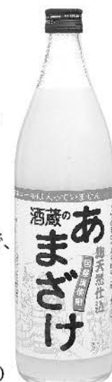
酒蔵のあまざけ 985g 754円 (税込814.32円)