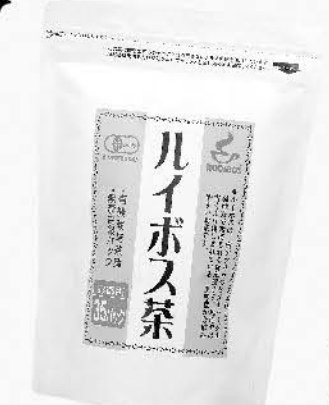
有機ライボス茶 (ティーパック) 105g(3g×35袋) 705円 (税込761.40円)

カフェインレスで子どもから大人、妊娠中でも安心して飲めるお茶です。ライボス茶にはミネラル類も入っているので、初夏の水分補給の飲みものとしておすすめです。チャックシール袋なので保管がしやすいのもポイントです!