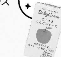
めまるっとりんごジュース 1本 125ml 119円 (税込128.52円)

美味しいりんご100%のストレートジュース。飲みきりサイズなので軽くて持ち運びに便利です。おでかけだけではなく、スポーツのおともにもオススメです。水分として、補食として!部活の差し入れとしてもとても喜ばれます。