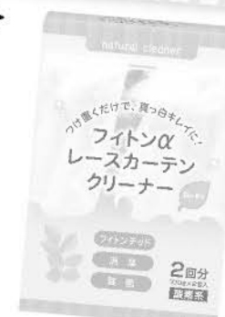
フィットンα レースカーテンクリーナー 1,320円 (税込1,452.00円)

お家で過ごす休日にはこれからの季節に備えてカーテンを洗おう! つけて置くだけでレースのカーテンが生地本来の白さになります。きれいなカーテンを揺らす風が心地よいです。