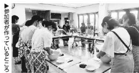
▲参加者が作っている味噌