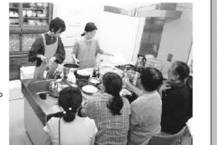
▲試食を調理する様子