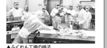
▲ふくれん工場の様子