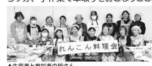
▲生産者と参加者の皆さん