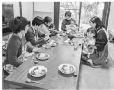
12/11 スリランカカレー作りを開催しました

2024年度は8組の親子で活動しました。毎年恒例の名札製作、紙コップマラカスやハロウィングッズの製作、料理教室の講師をしているメンバーによるスリランカカレー作りや親子ヨガなど、さまざまな企画をおこないました。例年よりも少人数でメンバーが忙しく、