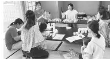
活動組合員による離乳食アピール