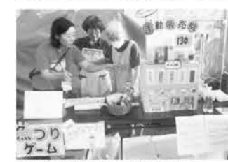
▲手動販売機はほぼ完売でした

目標をはるかに超えた600人の来場者数となり、支部一丸となって祭りを終えてみんな達成感を感じました。たくさんの方に来ていただき、とても素敵な10周年を迎えることができました。