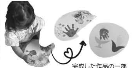
完成した作品の一部