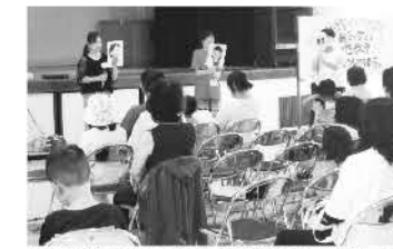
▲福祉委員による1000円基金アピール

展示コーナーでは使い捨て布ナプキン、月経カップ、シンクロフィットなどの最新の生理用品や講師おすすめの絵本を紹介してもらいました。生理用品一つとっても、驚くほど進化していることを教えてもらいました。