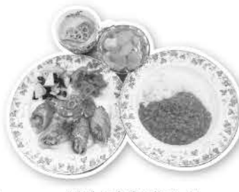
▲れんこんのフルコース

れんこん生産者やまびこ会婦人部の方がたをお招きして、れんこん料理会が開催されました。れんこん尽くしの料理会ということで、れんこんを使った豚肉巻き巻き揚げ、カレー、ヘルシーポタージュ、白玉のフルーツポンチの調理をおこないました。4つのグループに分かれて和気あいあいとした楽しい雰囲気でした。試食しながらお話を聞いて、除草剤を撒く回数を減らす分、手作業で草取りをおこなうことなど、土作りの大変さなどを学びました。皮は栄養価が高いので剥かない、水溶性のビタミンが流れてしまうため水にさらさないなど、今までのイメージとは違ったものになりました。参加者からは「レポートリーが増えてうれしい」「れんこんの効能が知れてよかった」との声があがりました。