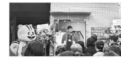
▲セレモニー!多くの人が集まりました

八幡西支部、2店舗目となる待望のキープ&ショップが、黒崎地域に11月26日(火)オープン。11月24日(日)にオープニングイベントが開催されました。当日は天候にも恵まれ、心待ちにしていた組合員や、ご近所の方など多くの人が集まりました。白を基調としたナチュラルな店内は、とても見やすくレイアウトされ、厳選されたおすすめ商品が揃っていました。店内では、おすすめのウインナー&ケチャップの試食。外では、子どもたちに人気のわたがしの販売、みんなに人気の野菜の詰め放題(じゃがいも、玉ねぎ、りんご)、ガラポン抽選会など大盛況でした。キープ&ショップくろさきは毎週火・水11時~18時、営業しています。これからが楽しみなキープ&ショップに、ぜひ一度足をお運びください。