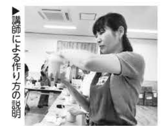
▲講師による作り方の説明