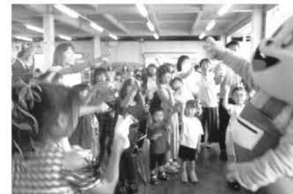
▲みんな大好き元気くん 大人も子どももみんなじゃんけんボン!

メーカーの㈱エムシーサービス、㈱ビッグファイブ、㈱小林甚製麺に参加をしていただき、商品もほぼ完売しました。「わたがしを当てに!」「カブト虫を狙って♪」「野菜の詰め放題を楽しみに来ました」と来場者から声を聞くことができ、とても嬉しかったです。『元気くんとじゃんけん』では、いろいろな世代の方が参加し、大人も子どももみんな楽しそうにじゃんけんをして、会場は笑顔と歓声で包まれました。