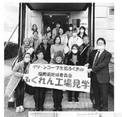
▲ふくれん工場の様子

参加者からは「学校の工場見学のようにわくわくして楽しかった」「日頃食べているものが安心安全だと分かり嬉しかった」「普段知らないことを知れて良かった」「今後は食べる時にも工場の方に感謝の気持ちが出てくる」などのたくさんの感想が聞けました。見学後はグリーンコープから店に寄り、昼食にから店のお弁当を食べました。またアウトレット商品の買い物も楽しめて、参加者の皆さん大満足の日となりました。小鉢 恵美