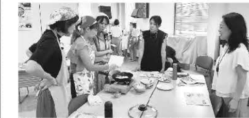
▲みんなで鉄フライパンを使ってみます

なんとなく「使うのが難しそう」と敷居の高いイメージのある鉄フライパンを、上手に手軽に使っていただけるようになることを目標に掲げ、学習会をおこないました。講師に鉄フライパンの特長と上手に使うコツを実演を交えて教えていただいた後、実際に使って予熱、油返しをしてから『冷凍産直キャベツの一口生餃子』と『生ハンバーグ(4個)』を焼いてみました。「食材を上手く焼く