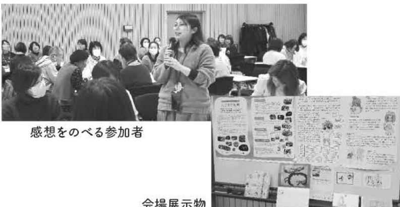
感想をのべる参加者