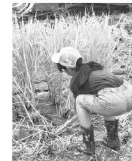
▲子どもたちも張り切って鎌で稲を刈っていきます

雨の予報が出ていましたが、多くの家族が楽しみにされていた毎年恒例のイベントが、無事に開催されました。例年よりは短時間で開催となりましたが、最後まで雨も降らずにみなさん楽しまれていたようです。公民館では、生産者のお話に熱心に耳を傾ける参加者の姿がありました。大人からはもちろん、子どもたちからも質問が出ました。頑張って作業した後に、試食で出された『赤とんぼ米ソフトせんべい』と『ソルティウォーター甘夏テイスト』も好評でした。「楽しかった」「すごく大変な作業をしていただいているお陰で美味しいお米が食べられていることがわかった」「これからも大切にお米を食べようと思った」などの感想を聞くことができました。