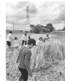
▲最後まで雨も降らずに稲刈りを楽しめました