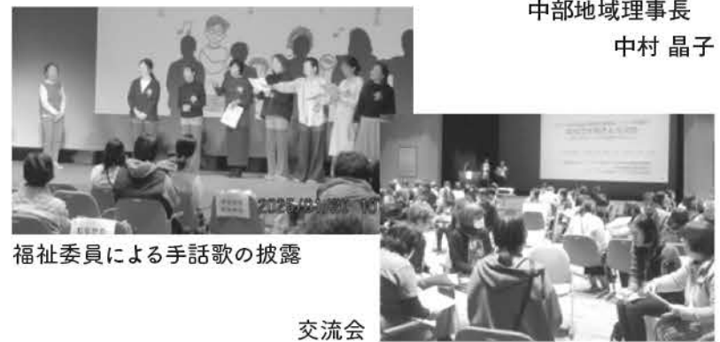
福祉委員による手話歌の披露