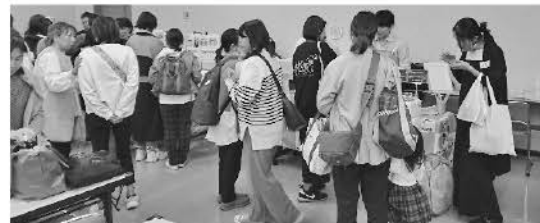
大賑わいの試食・お買い物タイム