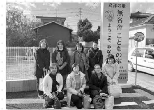
無名舎こどもの家見学