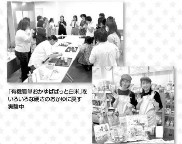
「有機簡単おかゆばつと白米」をいろいろな硬さのおかゆに直す実験中