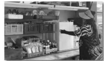
元気カーは、お弁当や野菜などいろいろな商品が揃っています