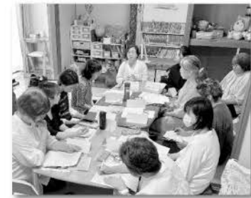
キラリ☆ひろばで講師を囲んでの学習会

みんなのいばしょ『キラリ☆ひろば』に行きました。子どもたちはそれぞれ好きなことをして過ごし「キラリは楽しい」と利用者は年々増加。ボランティア参加もあり、地域とのつながりもできています。スタッフの「お帰りなさい!」の掛け声で、大人も子どもも気軽に行けるようなアットホームな雰囲気の家でした。「自分が住んでいる地域に『キラリ☆ひろば』のような居場所を作りたい」という感想が出て、地域福祉の拡がりを実感した学習会でした。