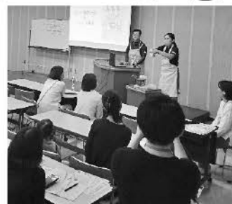
生クリームの立て方実演 (オーム乳業)

地域組合員や員外の方に、グリーンコープ商品のこだわりや良さを知ってほしいという思いから、8つのメーカーとBaby Greenの検討と開発に関わった離乳食開発プロジェクト委員会メンバーをお呼びして、福岡西支部主催で学習交流会をおこないました。