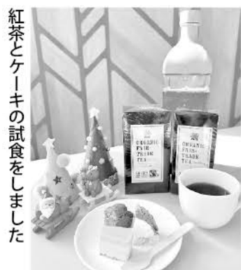
紅茶とケーキの試食をしました

千鳥店&福岡店の老朽化に伴い、統合することを決め、土地探しから始めました。何度も経営委員会をおこない、よりよいお店づくりを目指し、地域に寄り添ったふくつつ店をオープンすることができました。1階は店舗スペース、2階は地域交流室とパブリックスペースがあり、どなたでも利用できます。若い世代も多い地域で、ふくつつ店が《みんなの居場所》になることでしょう。みなさん、ぜひ、お立ち寄りください。