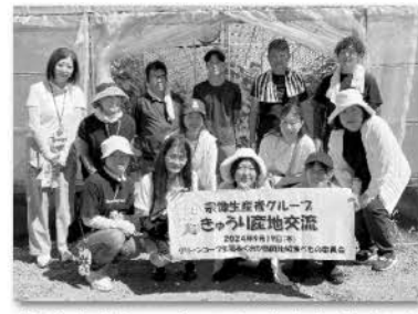
宗像生産者グループ きゅうり生産者の皆さんと

商品について「知りたい! 伝えたい!」という熱い思いを持ったメンバーが集まり、メーカー・生産者と出会い、毎回楽しく学習をおこないました。特に宗像生産者グループとの産地交流では、実際に現地を訪れ、産地の様子を直接見学することで生育の様子、異常気象の大変さを知り、生産者の想いに触れることができました。