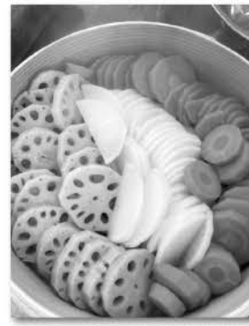
れんこん・人参・大根もホクホクに蒸しあげられました

木製品を扱っている酒井産業(株)の学習会では、適切に木を使うことや山を育てることについて学びました。座学後は、産直豚味噌漬けコースをせいろで蒸しました。豚肉の下にはキャベツを敷いて一緒に蒸し上げることでせいろも汚れず、キャベツはお肉の旨みがかしみて美味しくおすすめです。