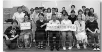
マルトモ(株)の方と一緒に

その結果、支部や地域からも離乳食としてだけでなく、様々なシーンで商品を活用してもらえるようなレシピが誕生しています。