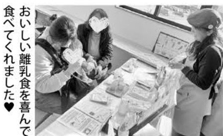
おいしい離乳食を喜んで食べてくれました♡