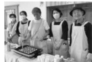
八幡西支部 たこ焼きの販売