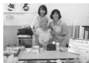
折尾若松支部若松東地域 お菓子と紅茶の販売