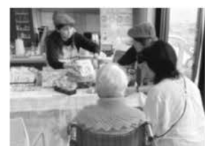
離乳食プロジェクトによる 試食アピール