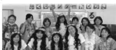
北九州地方ワーカーズ常勤メンバー

利用者の皆さんとゲームやカラオケ大会で盛り上がり、最後にみんなで一緒にフラダンスを踊り楽しい交流会となりました。