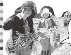
生産者と一緒に収穫体験