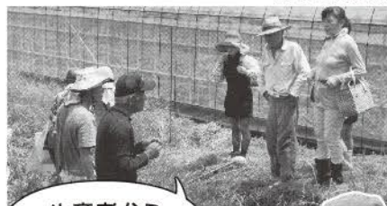
生産者からお話を聞きました