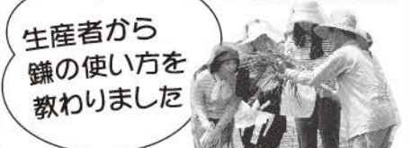
生産者から鎌の使い方を教わりました