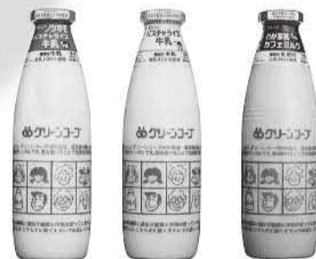
産直びん牛乳 ノンホモ 産直びん牛乳 パスチャライズ 産直わか家族 カフェミルク(びん入り)

牛乳は匂いを吸収しやすいので、紙パックだと冷蔵庫内の匂いが移ってしまうことも。びんはリユース、キャップはリサイクルする、環境にやさしい容器です。