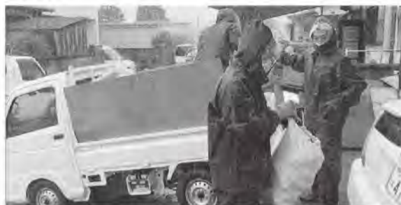
▲家具、廃棄物などの災害ゴミ片付け作業に行きました