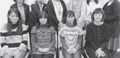
2020年度地域食べもの委員会のメンバーです。

今年度より地域に密着した食べもの委員会が発足しました。福岡地域は利用する組合員と働くワーカーズの距離がとても近いのが特徴です。毎回一緒に学習し、組合員の皆さんに商品の良さをどのように伝えようかと知恵を出し合いながら楽しく活動しています。