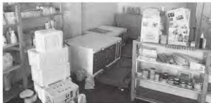
▲浸水で転倒した冷蔵庫と冷凍庫