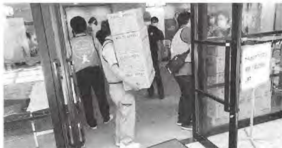
▲片付けをされている方が多く、お届けしたタオルが喜ばれました