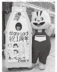
◀キープ&ショップわかまつ1周年

組合員が自分たちの地域にキープ&ショップが欲しいと声をあげ、担い手になったり、内装や外装にも積極的にに関わり、お店づくり増資の呼びかけもしています。