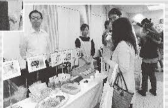
エルガーラホール(天神)でおこなった「グリーンフェスタ」でメーカーと一緒に交流(福岡地域)