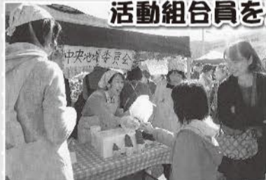
▲「来て 見て 遊んで グリーンコープの秋まつり」に地域委員会で出店(大牟田支部)