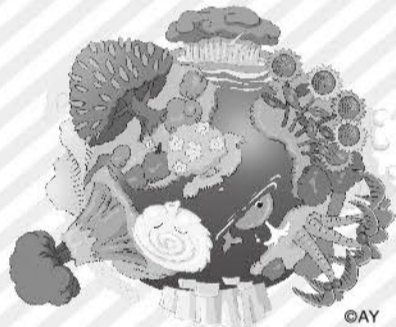
この街は、グリーンコープの「ホシ」。

今まで積み重ねてきた私たちのグリーンコープ運動を内外へ大きく知らせ、次の10年間へつなげましょう。