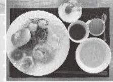
◀「作ってパンランチ」(筑紫支部)