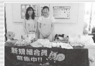
郵便局でのイベント。笑顔で「牛乳いかが〜」(小倉南支部)