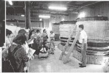
▼庄分酢の工場を見学(宗像支部)