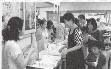
▲キープ&ショップ下月限店2周年祭

前年度7ヶ所のキープ&ショップがオープンしています。これからもそくそくと登場します！