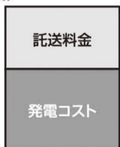
(電気料金のイメージ)

「託送料金」とは、グリーン・市民電力などの新電力会社が、大手電力会社に支払う「電線使用料」のことで、なんと、電気料金の1/3を占めているんだよ。