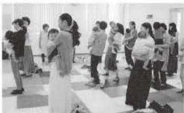
親子体操でリフレッシュ

親子遊びの後は、牛乳のレンネット実験や試食もあり、みんなニコニコ笑顔でとても楽しい会となりました。 (広報委員 柳本 真由美)